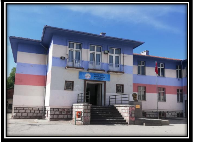
Barakanın Geçmiş ve Şimdiki Zamanı