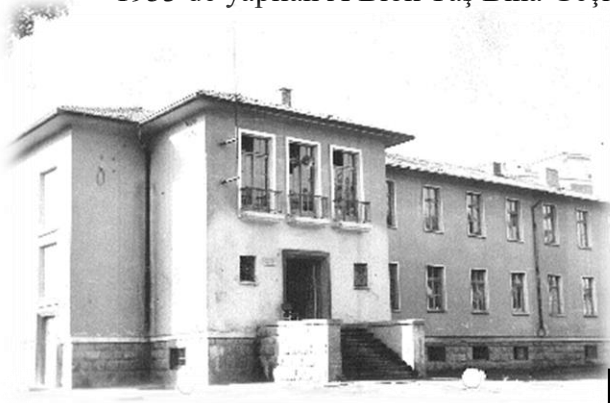
1953 de yapılan A Blok Taş Bina Geçmiş ve Şimdiki Zamanı